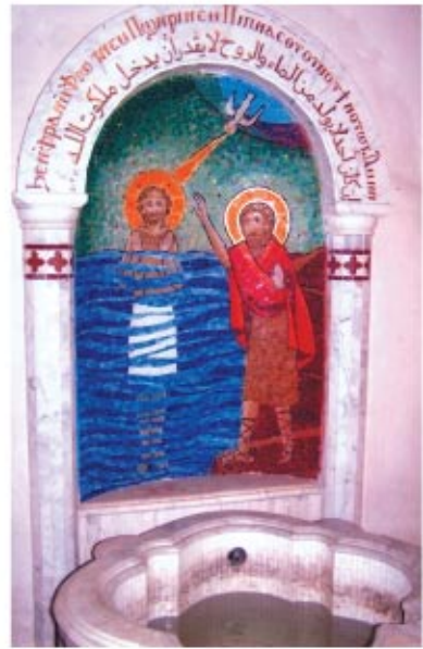
نماذج من شغل الموزاييك.