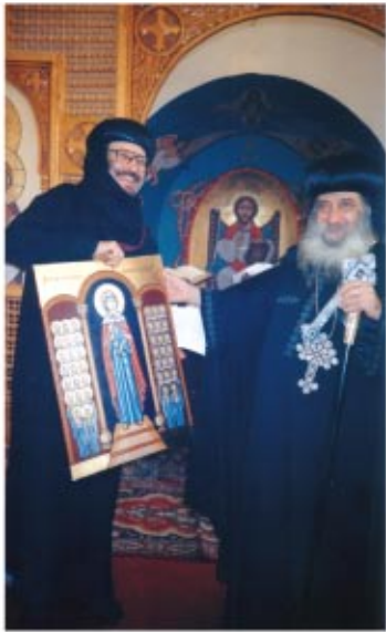
قام قداسة البابا شنودة الثالث برسامة ٨ راهبات في ١/٤/١٩٩٥م في كنيسة الأنبا شنودة بدير الأنبا بيشوى. وقام نيافة الأنبا بيشوى بتقديم أيقونة القديسة دميانة لقساسته من عمل راهبات الدير .