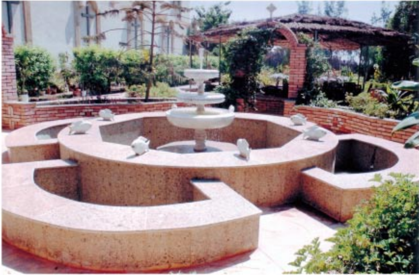
النافورة الموجودة بالحديقة