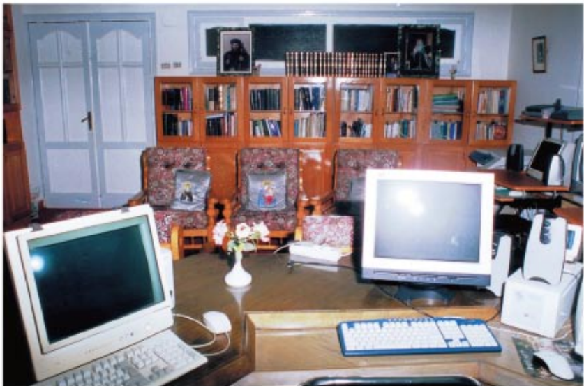
مركز الكمبيوتر والأبحاث الروحية والعقائدية بمبنى الراهبات