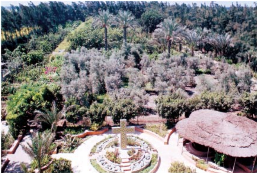
منظر يشمل الحديقة