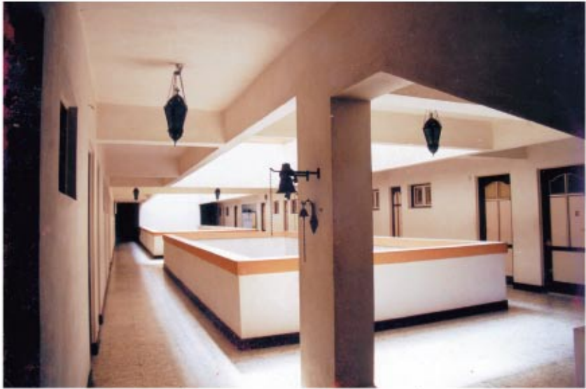
إحدى الطرقات بمبنى الراهبات توضح بعض من قلالى الراهبات