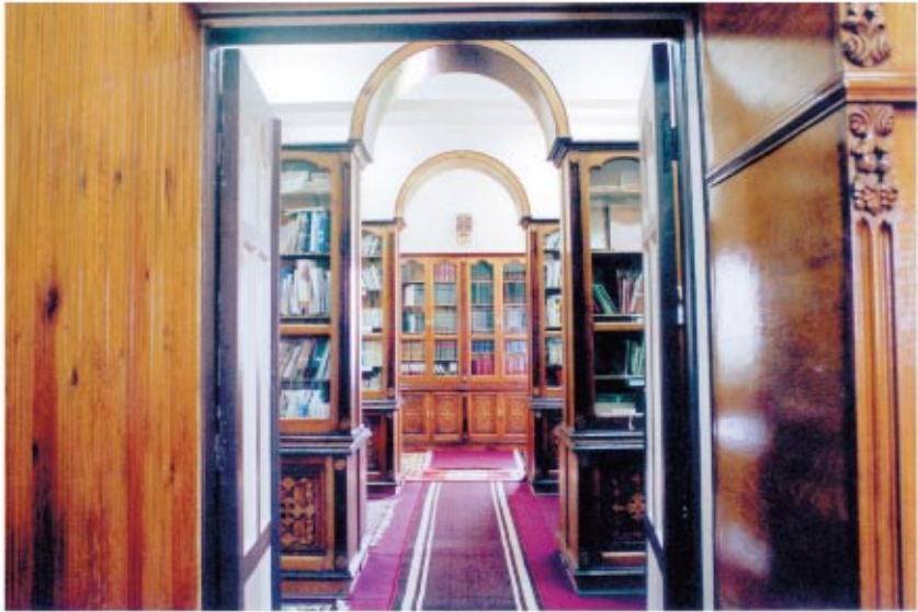
المكتبة التي تحوى المخطوطات والكتب الروحية والعقائدية والثقافية بمبنى الراهبات