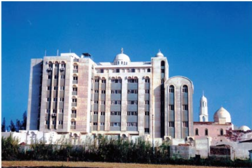
الناحية القبليّة لمبنى الراهبات وهي خاصّة بمناطق العمل اليدوي للراهبات وسيظهر في الصور التّالية بعض نماذج من هذا العمل اليدوي