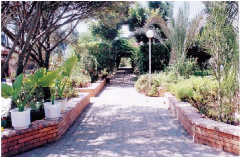
مدخل الحديقة الخاصة بالراهبات