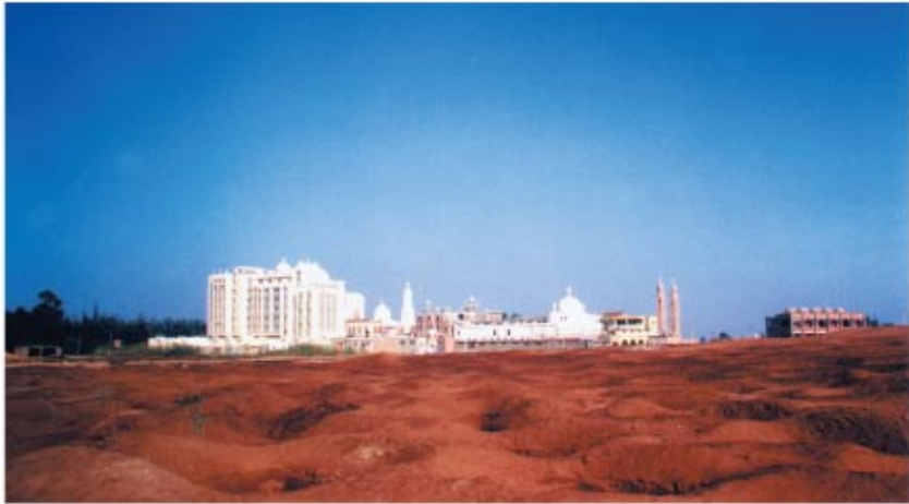
التل الأثرى ومنظر عام للدير من الناحية الشرقية القبليّة