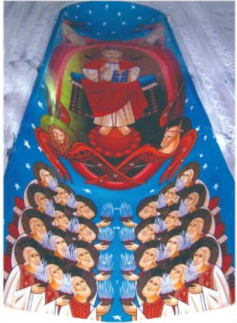
نماذج من رسم الفن القبطى وأيقونات وشرقيات للهياكل قد يصل طولها إلى ما يقرب من ١٠متر أو أزيد