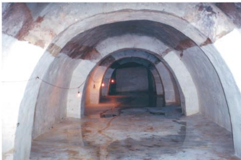
صهريج المياه الأثرى أسفل القلالى الأثرية بتفص طول صف القلالى