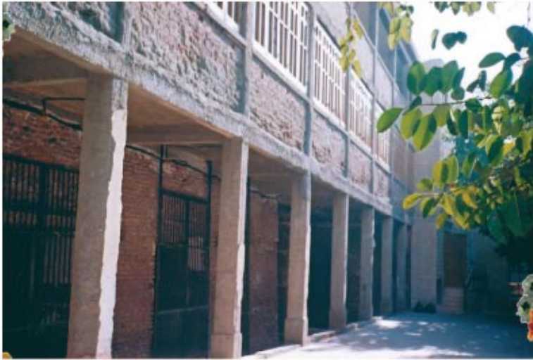
القلالي الأثرية التي أسفل بيت الخلوة