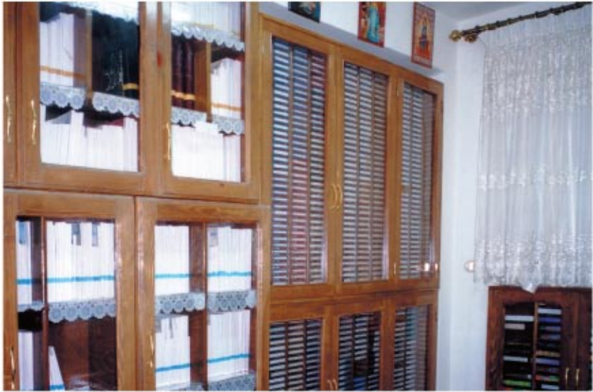
المكتبة الاستعارية للكتب والشرائط الروحية الخاصة ببيت الخلوة