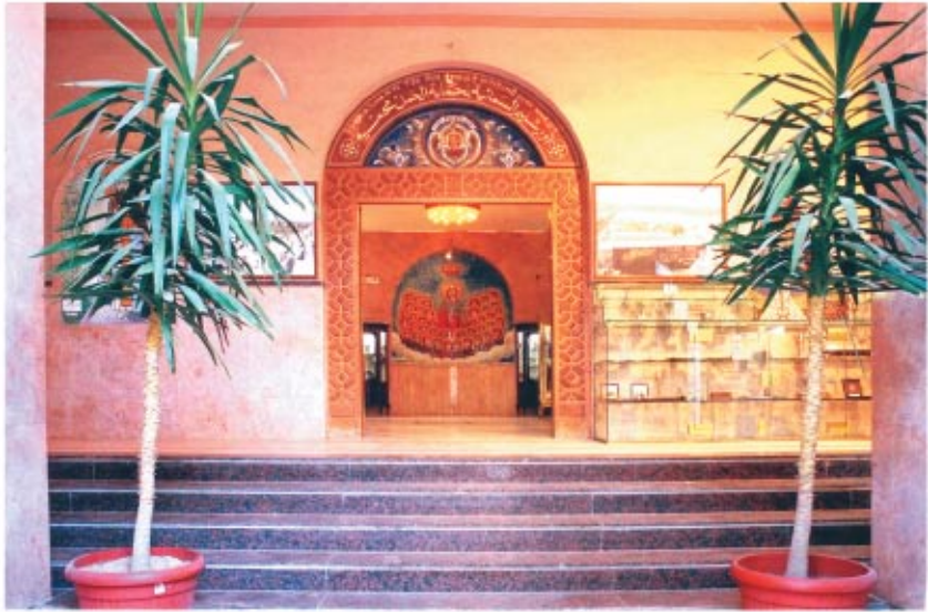
مدخل مبنى الراهبات الجديد