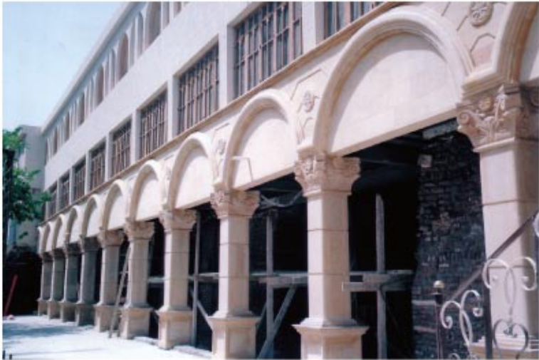
تغطية العشرة أعمدة الأثرية أمام القلالي الأثرية التي أسفل بيت الخلوة بالحجر الهاشمي وتزيين الأعمدة بتيجان محفور عليها صلبان، ويعلوها تسعة عقود دائرية من الحجر الهاشمي