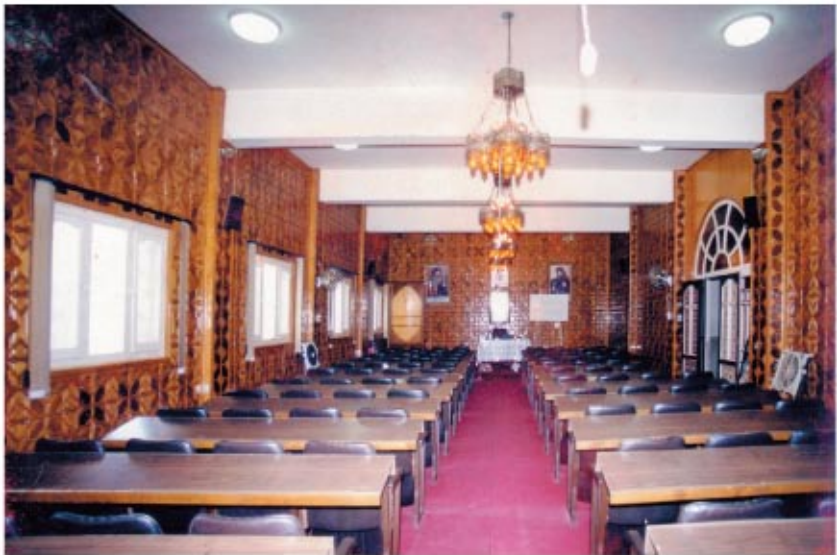
قاعة الاجتماعات بالدور الأرضي بمبنى الراهبات