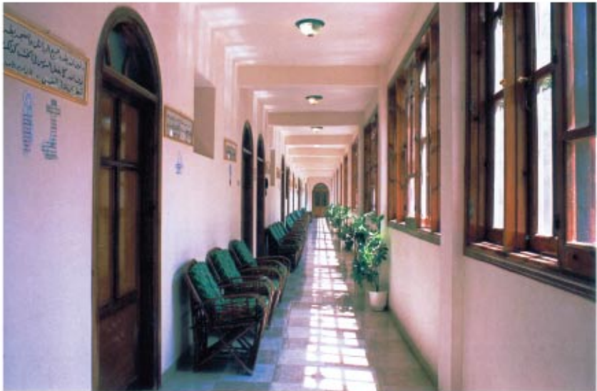
إحدى طرقات بيت الخلوة وتظهر القلالي على الجانب الأيسر