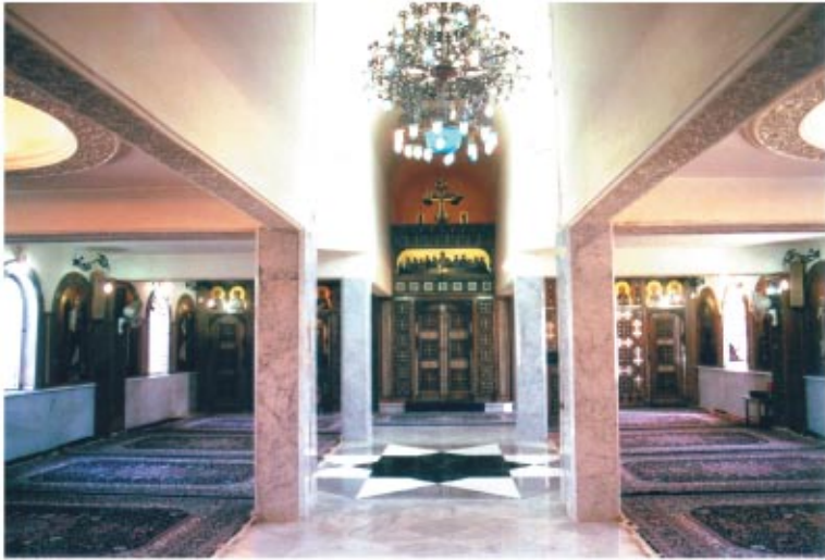
كنيسة الملاك ميخائيل بأعلى مبنى الراهبات