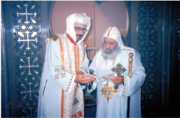
قداسة البابا شنودة الثالث ونيافة الأنبا بيشوى أثناء صلوات تدشين مذبح كنيسة الملاك ميخائيل في ١٩٩٦/٣/٢٤م