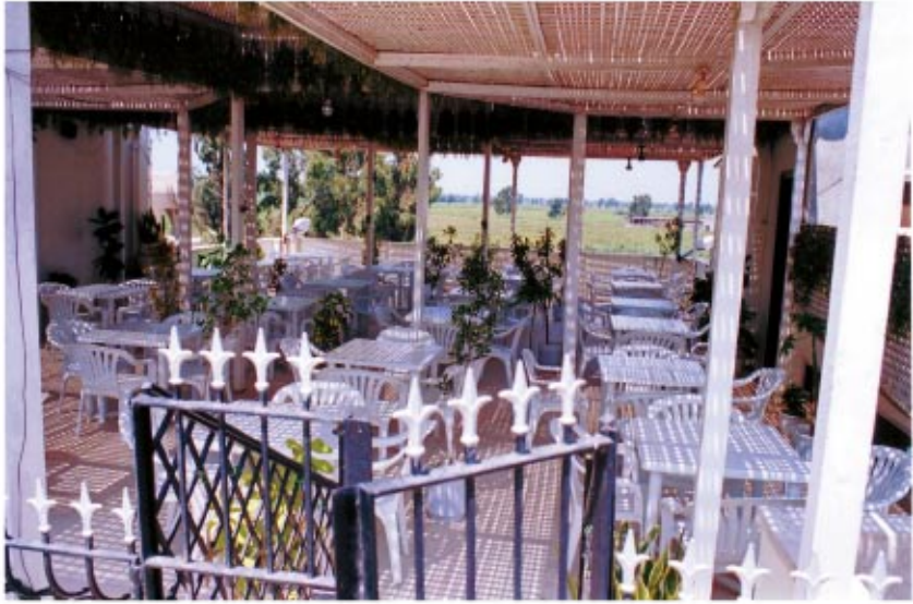
سطح بيت الخلوة بعد تجهيزه بمظله كبيرة ليصلح لجلسات روحية هادئة