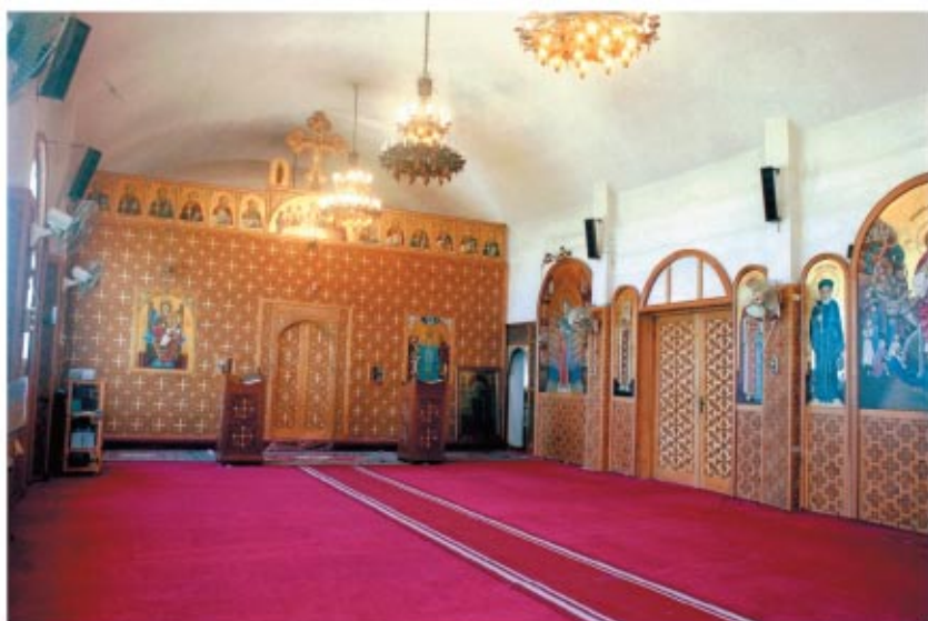
كنيسة الشهيدة دميانة بمبنى الراهبات