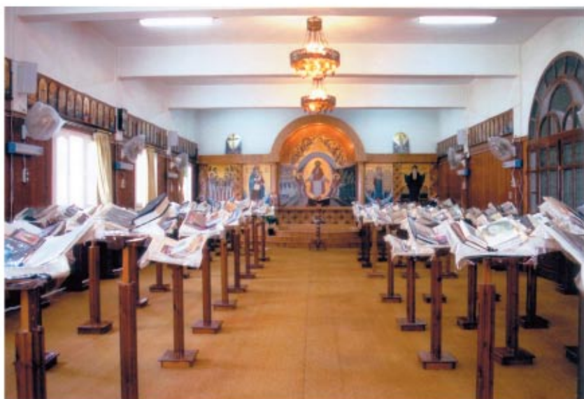
قاعة الصلاة والتسبيح بمبنى الراهبات